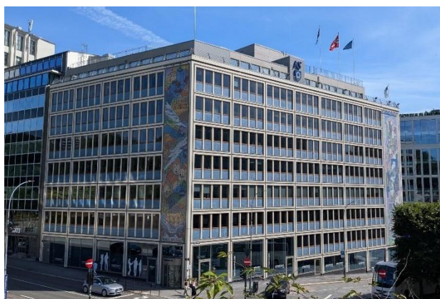
Kommunenes hus ved Nationaltheatret stasjon i Oslo

Sekretariatet har i perioden fortsatt arbeidet med å fornye foreningens administrative systemer. Det har vært en tidkrevende prosess med læring og feiling. Før jul ble det leid inn bistand fra konsulenthuss med erfaring fra lignende prosesser. De bisto sekretariatet med tydeliggjøring av kravspesifikasjonen og intervju med aktuelle kandidater. Valget falt på nåværende leverandør av nettsiden og de har fått i mandat å utarbeide både medlemssystem og læringsportal. Planlagt ferdigstilling og lansering er satt til denne sommeren. Dette skal gi en bedre utnyttelse av ressursene, samtidig som medlemsopplevelsen skal bli mer strømlinjeformet.